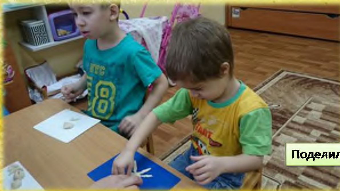
Поделились тестом и с другими детьми.