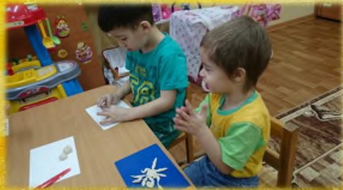
Дети с ОВЗ из соседней группы лепят «Солнышко» из солёного теста.